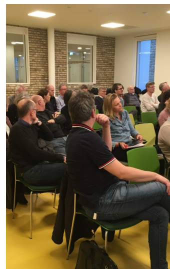
Første møde i Dansk Kræftforum 13. marts 2018